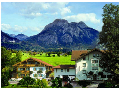
Hotel Rübezahl 87645 Schwangau-Horn www.neuschwanstein-hotel.de